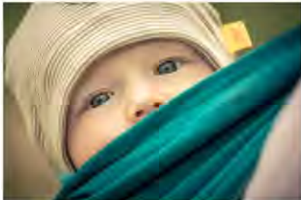
Kinder möchten getragen werden - sie sind Traglinge!

Mit Trageberaterin Christin Weisbrod Zenker