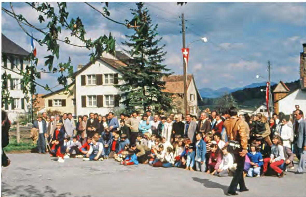
Abschiedsbild der 110 Bourgognern mit den Arboldswiler Gastfamilien am Sonntag, 2. Mai 1982

Die Geschichte wiederholt sich, muss man in diesen Tagen traurig sagen, da der russische Staatspräsident aus unverständlichen Gründen das südliche Nachbarland Ukraine angreift und die ukrainische Bevölkerung in unsägliches Leid und Elend stürzt. Unzählige Hilfsgütertransporte werden aus Europa und anderswo nach der Ukraine organisiert. Dies erinnert Arboldswiler und Bourgognern an